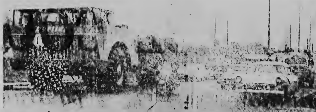
TRUCK DI MAS GRANDI: — E truck comercial di mas grandi na mundo traha na Lyons...